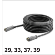
29, 33, 37, 39